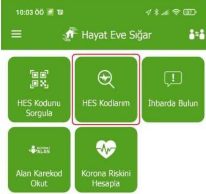
Resim 1. Hayat Eve Sığar Uygulaması HES Kodu Temin Etme Ekranı